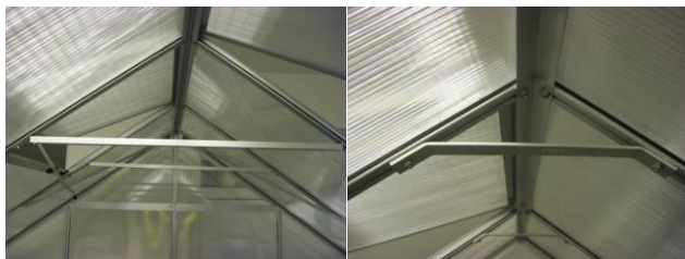
vzpěry ve značkových výrobcích Merkur a Venus (výroba Vitavia Garden GB, dodává Lanit Plast)