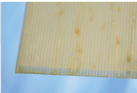
polykarbonátová deska po 7 měsících a velkém středočeském srpnovém krupobití (stav desky - konec září 2010)